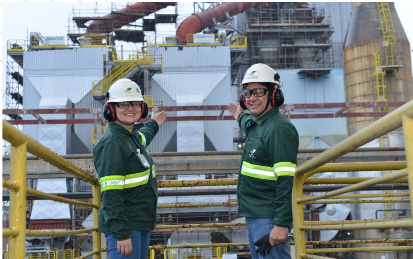
PRECIPITADOR ELETROSTÁTICO: MENOS PARTÍCULAS, MAIS QUALIDADE DE VIDA