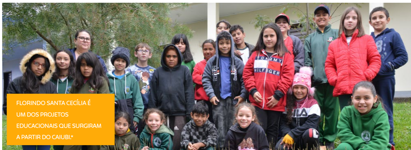
FLORINDO SANTA CECÍLIA É UM DOS PROJETOS EDUCACIONAIS QUE SURTIRAM A PARTIR DO CAIUBI.*

Realizado há 17 anos pela Klabin, em parceria com a Associação de Preservação do Meio Ambiente e da Vida (Apremavi), o Matas Legais chegou à Santa Catarina em 2005, com o objetivo de desenvolver ações de conservação, educação ambiental e fomento florestal, que ajudam a proteger e recuperar as florestas nativas.