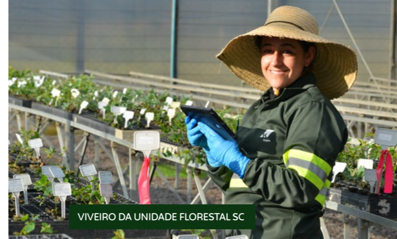
VIVEIRO DA UNIDADE FLORESTAL SC

Florestal SC Florestas de pinus e eucalipto