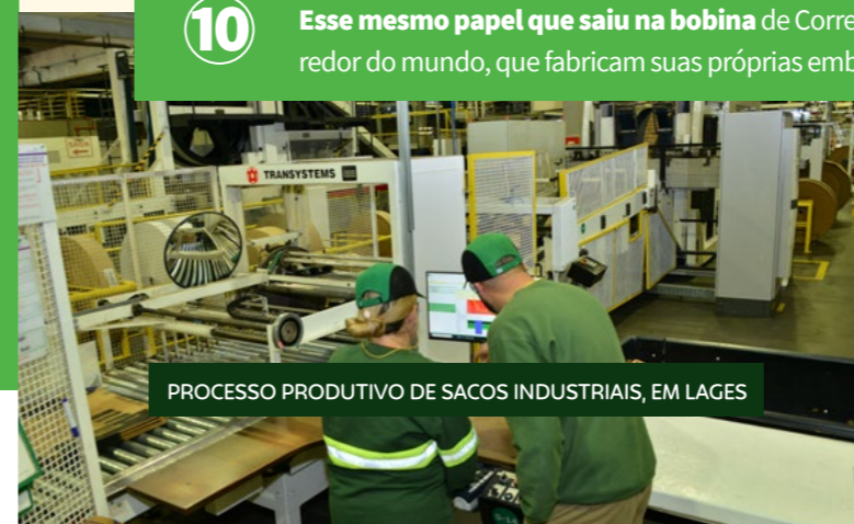
PROCESSO PRODUTIVO DE SACOS INDUSTRIAIS, EM LAGES