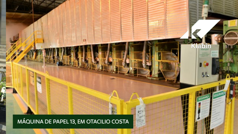
MÁQUINA DE PAPEL 13, EM OTACILIO COSTA