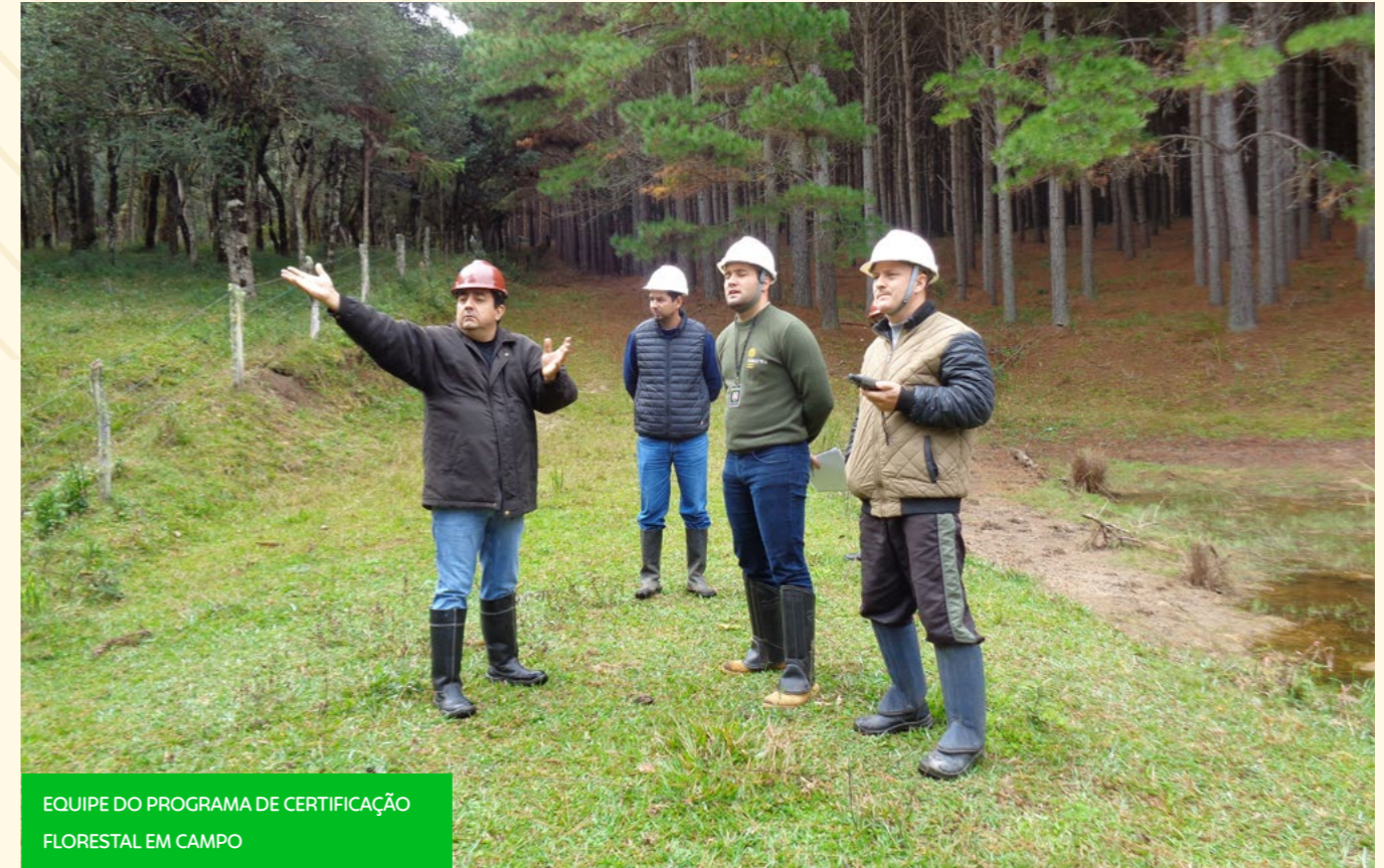
EQUIPE DO PROGRAMA DE CERTIFICAÇÃO FLORESTAL EM CAMPO